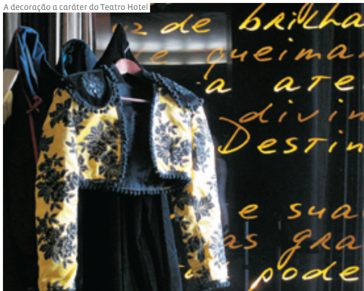
A decoração a caráter do Teatro Hotel