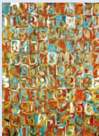
"Numbers in Color", encáustica e óleo sobre tela, executada em 1958.

Aí, torna-se amigo de Cage e Merce Cunningham, para quem faz os cenários para alguns bailados, e Rauschenberg, de quem se torna amante. Em 57, cruza-se com Leo Castelli, o galerista que lhe proporciona a primeira exposição individual, em 58, ano em que também participa na Bienal de Veneza. Galardoado com vários prémios, em 1990 recebe a Medalha Nacional das Artes. Vive entre Sharon e Saint Martin.